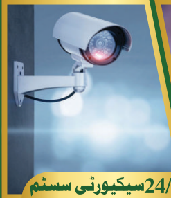
24/7 سیکیورٹی سسٹم

اسلام آباد کی سب سے بڑی شاہراہ کشمیر ہائی وے اور نیو اسلام آباد ایئر پورٹ کے پہلو میں، فتح جنگ روڈ پر واقع ہے۔ اور نیو اکنامک گروٹھ ذون کی اہم شاہراہوں موٹروے، رنگ روڈ، سی پیک سے بھی جڑا ہوا ہے۔