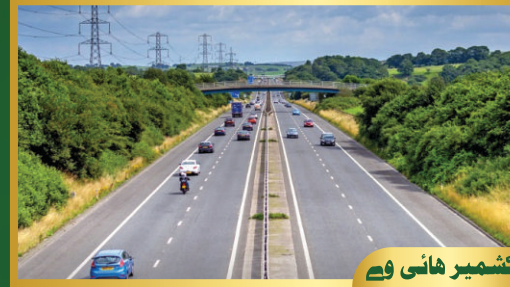
کشمیر ہائی وے

گریس لینڈ ہاوسنگ میں زیر زمین بجلی، سوئی گیس کی فراہمی، پینے کا صاف پانی، سیوریج کا نظام، گیٹڈ کمیونٹی اور 24/7 سیکیورٹی ایک خوشنما زندگی کی ضمانت ہے۔