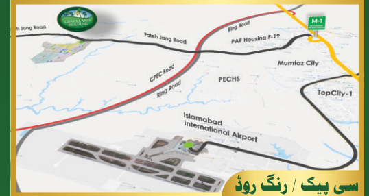
سی پیک / رنگ روڈ