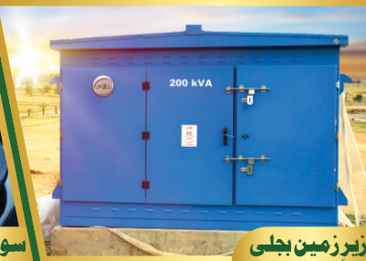
زیر زمین بجلی