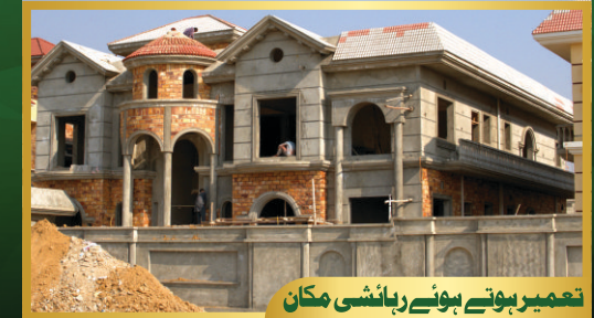
تعمیر ہوتے ہوئے رہائشی مکان