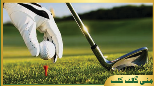
منی گالف کلب