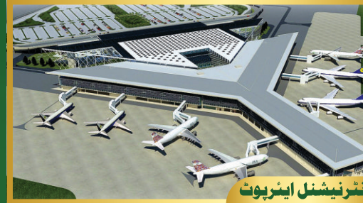
انٹرنیشنل ایئر پورٹ