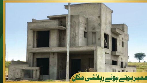
تعمیر ہوتے ہوئے رہائشی مکان