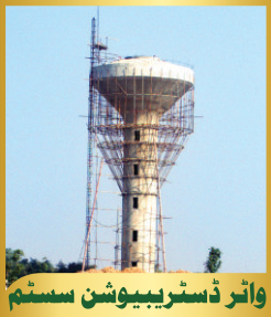
وائر ڈسٹریبیوشن سسٹم